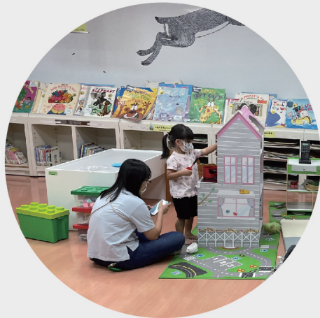
總館「兒童五感遊戲區」

「兒童五感遊戲區」內提供超市、烹飪等與兒童生活經驗相關的角色扮演玩具，以及具創造性的樂高及拼圖玩具，營造共讀、共玩、共學的圖書館空間。