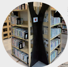
總館小小世界外文圖書館多國語言童書專區

除了提供豐富的中、英文兒童館藏外，總館地下2樓還設有「小小世界外文圖書館」提供日文、法文、德文、西班牙文、俄文、荷蘭文等多國語言童書及兒童文學獎項得獎圖書，擴展、豐富兒童的視野及國際觀。