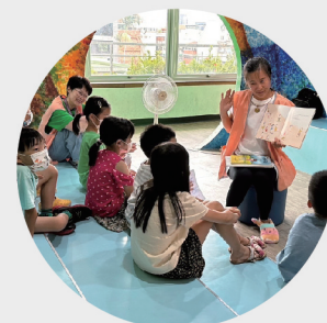
總館「立體書展示區」