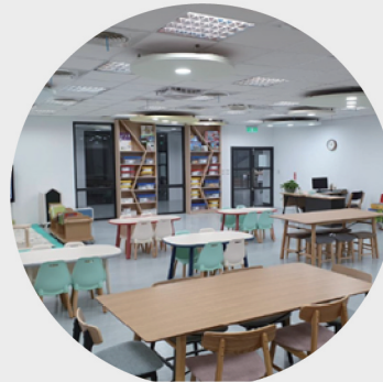
大同分館「祖孫代間共學中心」

分館兒童閱覽區全市各服務據點均設有兒童閱覽室(區)，讓孩子在童趣、好玩又新奇的特色閱讀空間，或坐或趴，隨處都是放鬆的閱讀角落，恣意徜徉於書中世界。