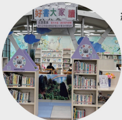
總館兒童室好書大家讀專區