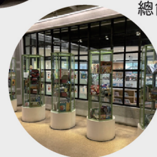
總館「立體書展示區」