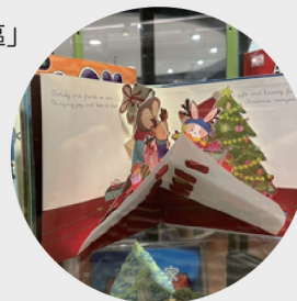
總館「立體書展示區」