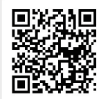
臺北市立圖書館 兒童電子圖書館網站