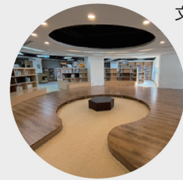
文山分館親子共讀區