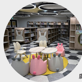
廣慈分館兒童閱覽區

分館兒童閱覽區全市各服務據點均設有兒童閱覽室(區)，讓孩子在童趣、好玩又新奇的特色閱讀空間，或坐或趴，隨處都是放鬆的閱讀角落，恣意徜徉於書中世界。